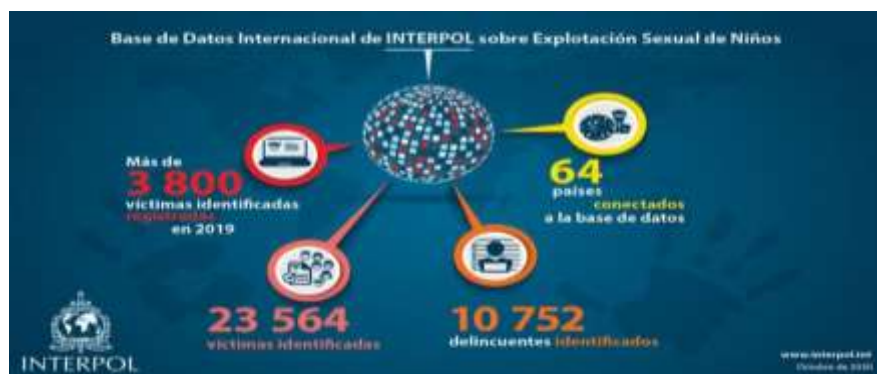
Figura 1: Explotación sexual